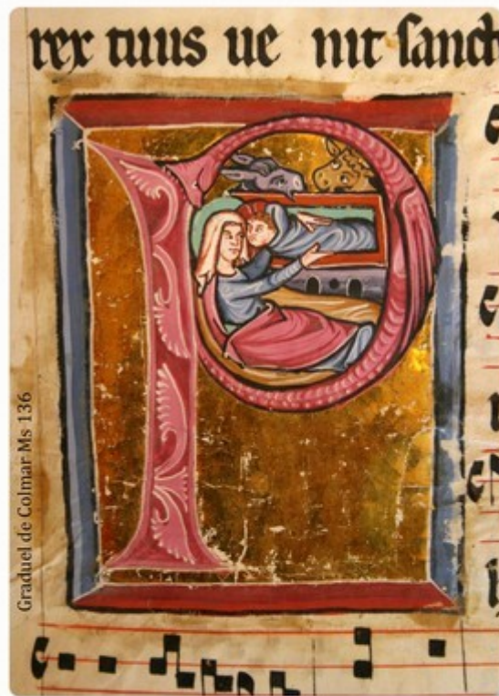
Graduel de Colmar Ms 136

Point de courriel ou de tweet, mais un ange au phylactère pour annoncer une naissance dont on reparlera. En attendant que sonne cornemuse !