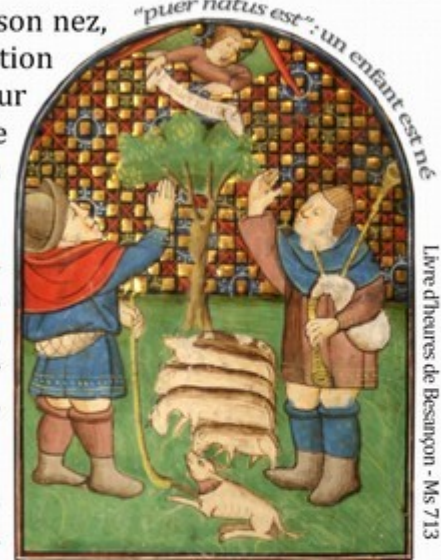
Libre d'heures de Besançon - Ms 713

Il faut cependant les comprendre, à défaut d'en accepter les diatribes. Ces animaux dits sauvages ou domestiques, indépendants ou quasiment serviles n'ont que peu de temps - tout juste une journée, celle du 25 décembre - pour exprimer toute une année de frustration quant à ne pouvoir répondre aux humains dans le langage qui est leur.